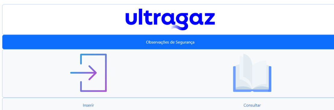
Figura 1 – Tela de entrada no sistema

A aplicação é acessada via browser, com a tela inicial conforme apresentado na figura 1.