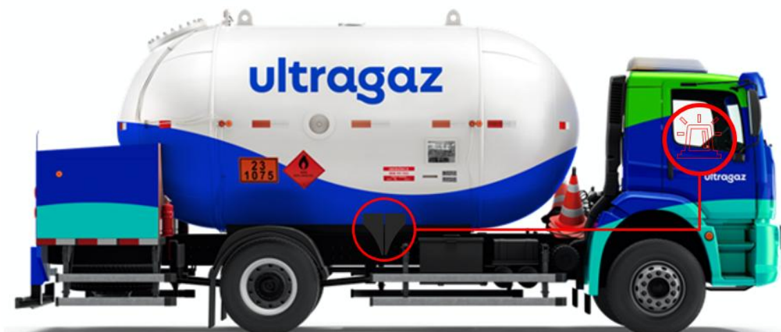
Sinal luminoso apagado na cabine sinalizando a necessidade de calçar o caminhão

Além da praticidade, a solução demonstra a capacidade de inovação dos times internos da Ultragaz, que aliam criatividade e engenharia simples para fortalecer a cultura de segurança e eficiência operacional.