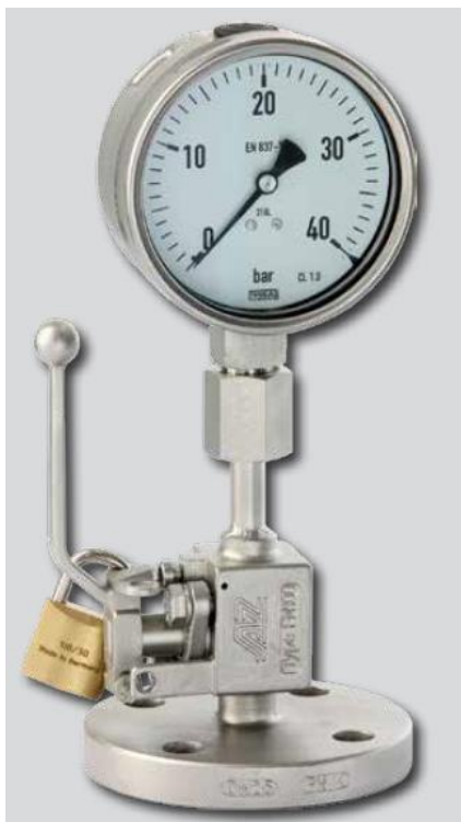
Figura 3 Válvula Macho Manométrica

Identificado o fator de segurança na operação da remoção dos manômetros, foi verificado através de interação com o mercado, que o problema poderia ser resolvido de forma simples utilizando-se um conjunto com válvula macho e alívio incorporado, no qual o manômetro é acoplado (Figura 3 e 4).