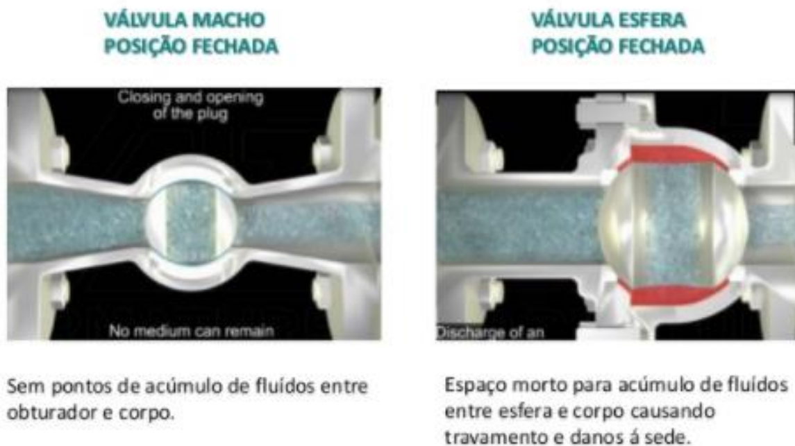
Figura 5 – Comparação válvula macho e válvula esfera

A válvula macho tem um sistema de obturador cônico, o que não gera acúmulos de fluido nos chamados “ponto morto” (Figura 5) no corpo da válvula, isso já ocorre em válvulas do tipo esfera.