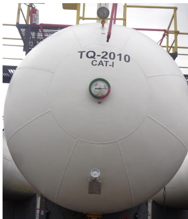
Figura 1 (Tanques estacionários)

Todos os tanques estacionários instalados nas filiais Ultragaz hoje, possuem um manômetro (Figura1). O manômetro tem o objetivo de mostrar a pressão interna do tanque, variável importante na apuração da quantidade de GLP, no controle das condições de segurança do armazenamento indicando se é necessário tomar alguma providência, como por exemplo, o resfriamento do tanque em dias de calor elevado.