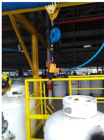
Figura 6: Balancim de sustentação da chave pneumática

Peso: A ferramenta utilizada para a retirada de válvulas tem um peso de 6,5 Kg. Para evitar a sobrecarga principalmente de membros superiores e coluna vertebral, associado a contração estática ao sustentar o peso da ferramenta fez-se o uso de balancim, de forma que o equipamento permaneça centralizado em relação ao vasilhame. Essa configuração facilitou o manuseio, garantindo que o operador não precise adotar posturas inadequadas para o alcance, além de permitir o reposicionamento adequado do equipamento durante a operação.