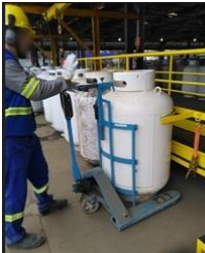
Figura 7: Movimentação e posicionamento do(s) Vasilhame(s)