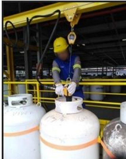
Figura 9: Desmontagem e remoção de Válvula