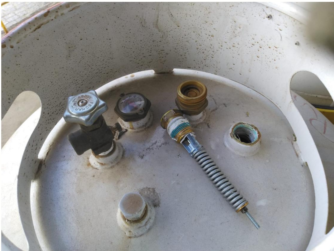
Figura 11: Vasilhame transportável com a válvula retirada

Dado o sucesso do projeto, ele será replicado em outras filiais da empresa a nível nacional garantindo ainda mais a padronização dessa atividade de maneira corporativa visando a excelência operacional.