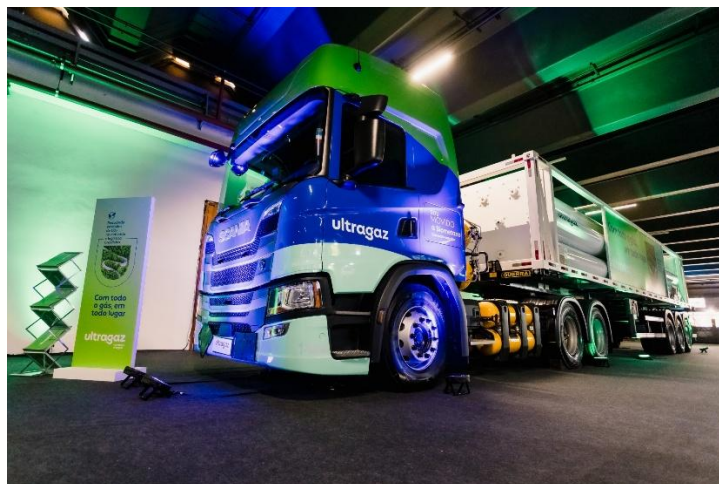
Figura 1: Caminhão transportador de biometano

A Ultragaz expandiu sua rede de atendimento por meio da aquisição de outras empresas, aumentando seu alcance e a eficiência de suas operações. Atualmente, diversifica suas fontes de energia com a aquisição de empresas como Stella Energia, NEOGás e Witzler, consolidando-se como pioneira na inovação. Dessa forma, após 88 anos de atuação no mercado, a Ultragaz continua levando aos brasileiros as melhores soluções de energia, seja em GLP ou em outras formas.