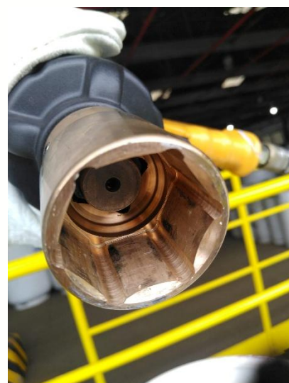
Figura 5: Soquete de Cobre Berílio