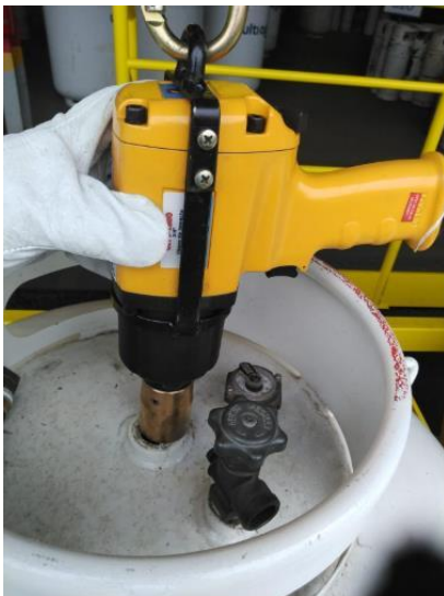
Figura 4: Chave de Impacto Pneumática

Para evitar qualquer fonte de ignição no local foi utilizado sistema de alimentação pneumática e uso de chave de impacto pneumática intrinsecamente segura com soquete anti-faiscante (material CU = 98,2 % / BE = 1,8 a 2,4% / Ni+Co+Fe = 0,35% a 0,60% / Al+Si < 0,40%).