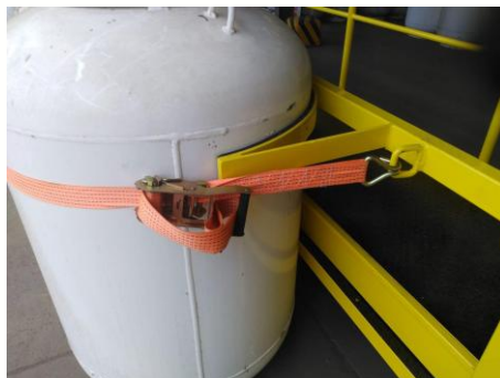
Figura 8: Amarração de conjunto de vasilhames