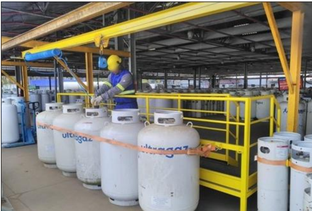
Figura 10: Plataforma de retirada das válvulas dos vasilhames com chave pneumática

Agilidade do Trabalho: Esse processo como um todo e aplicando o projeto traz redução de tempo de atividade de desmontagem das válvulas.