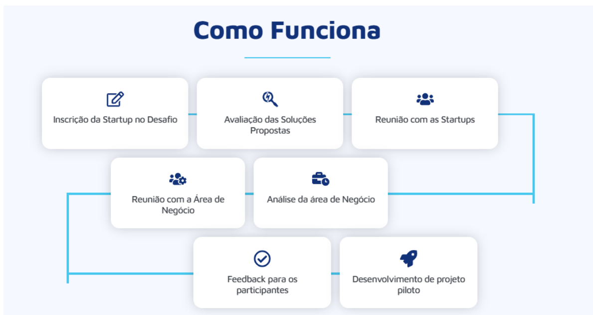
Figura 7 Site Liga Lab – Como Funciona