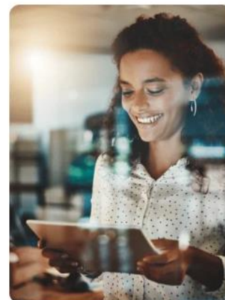
Figura 8 Site Liga Lab – O Que Oferecemos

O site foi integrado a ferramentas externas de gestão , utilizadas para receber e organizar os formulários de inscrição e de participação em desafios. Essa integração permitiu maior eficiência na coleta de dados e na análise das informações.