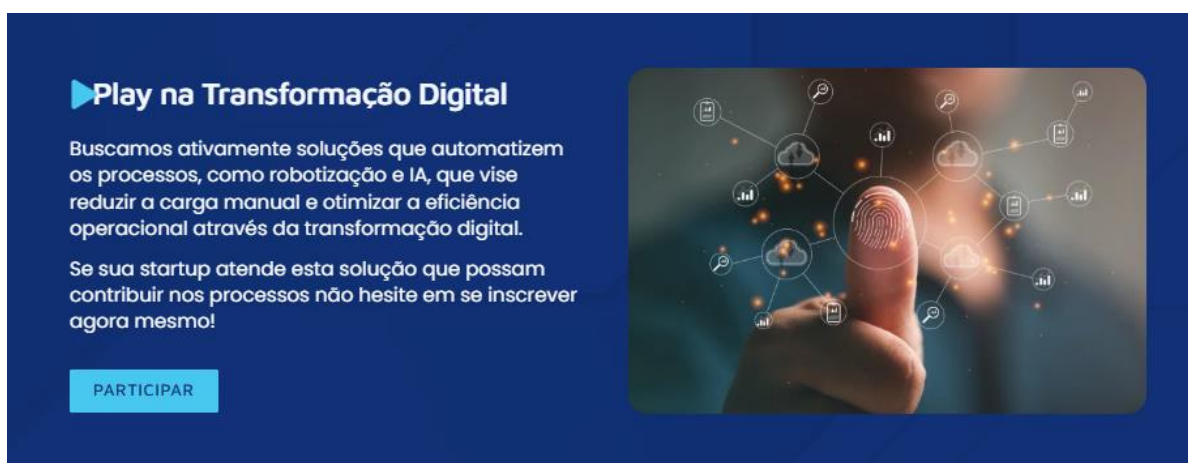
Figura 4 Site Liga Lab – Transformação Digital