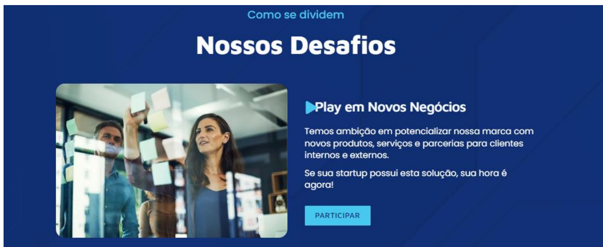
Figura 3 Site Liga Lab – Nossos Desafios