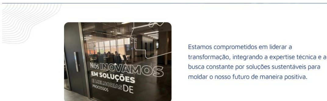
Figura 2 Site Liga Lab – Quem Somos