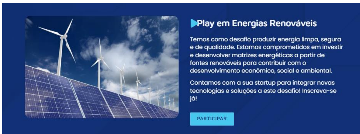
Figura 5 Site Liga Lab – Energias Renováveis