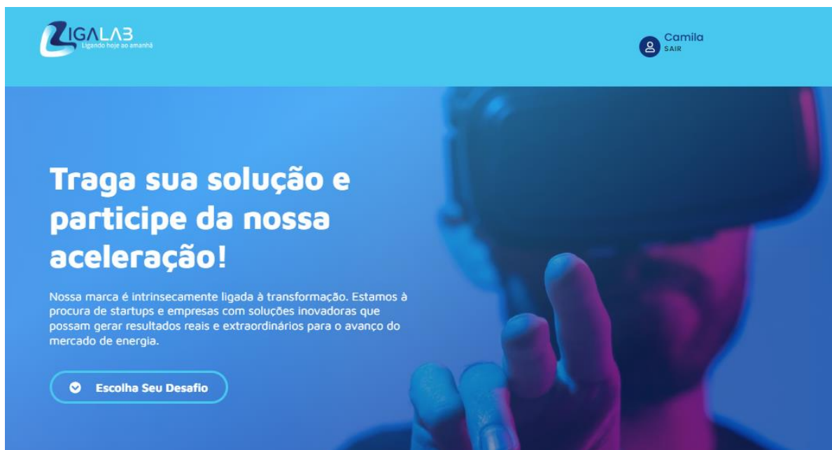
Figura 10 Site Liga Lab – Home Desafios