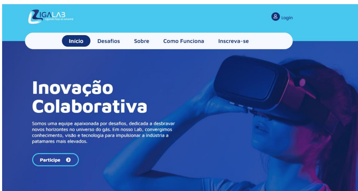
Figura 1 Site Liga Lab - Home