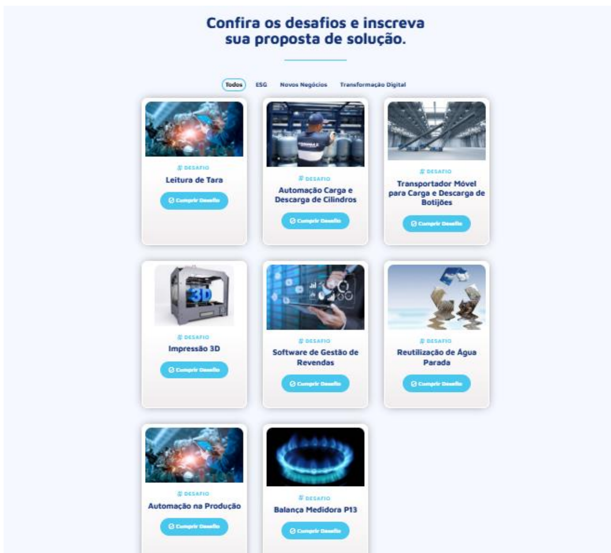
Figura 11 Site Liga Lab – Desafios