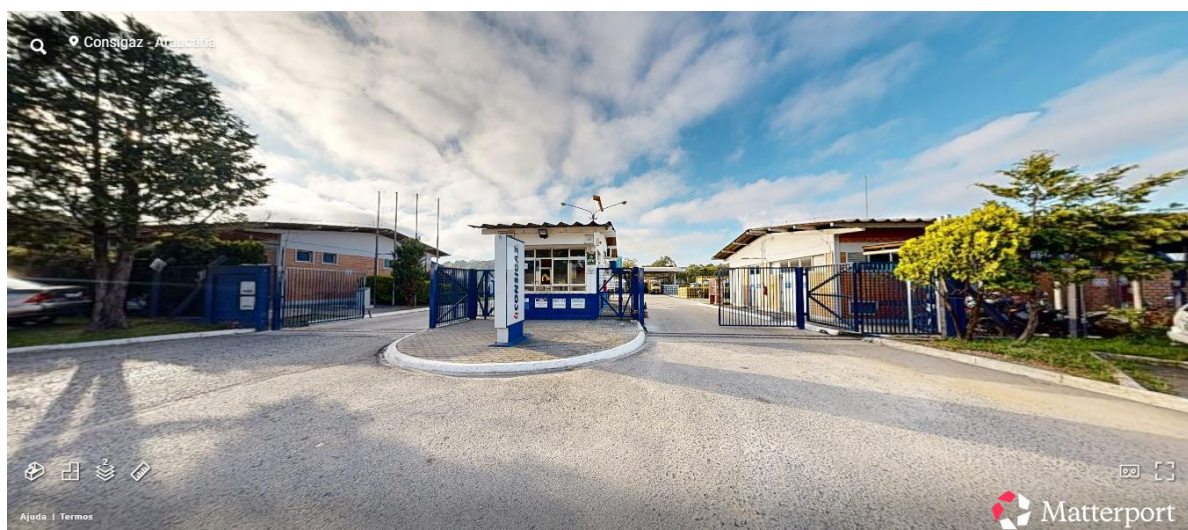
Figura 2 Tour Virtual Bases