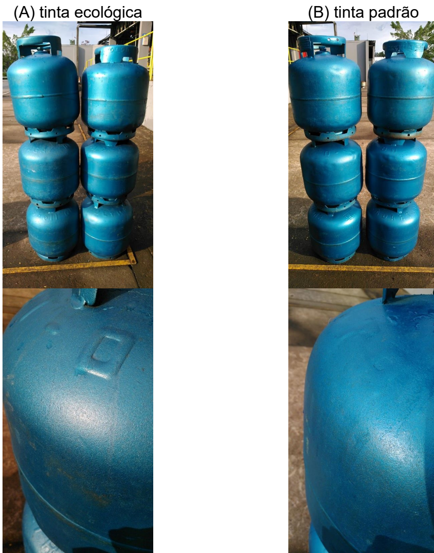
Figura 2- Exposição ambiental dos recipientes P13 com a tinta ecológica (A) e com a tinta padrão (B).

Com a introdução do novo insumo, alguns operadores relataram desconforto pontual relacionado ao odor da tinta. Historicamente, esse tipo de reação tende a diminuir com o tempo, à medida que o organismo se adapta ao novo composto.