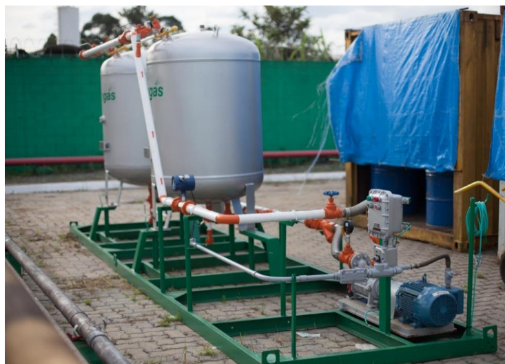
Figura 2 - Instalação-teste utilizada para os ensaios

Todos os equipamentos e acessórios foram montados sobre uma estrutura metálica que permite a movimentação e deslocamento da instalação-teste, como um sistema SKID. Para o dimensionamento e projeto da instalação, foram considerados os distanciamentos de segurança e demais características da ABNT NBR 13523. As instalações da bomba e medidores respeitam os distanciamentos e posicionamentos determinados pelos fabricantes.