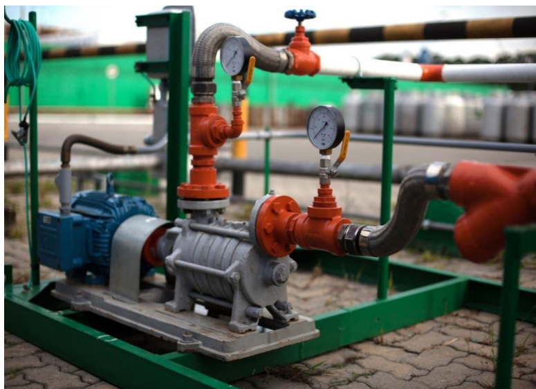
Figura 3 - Detalhe da instalação da bomba

O procedimento seguido na execução dos testes foi: