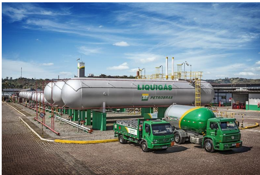
Figura 1 - Centro Operativo de Capuava

No segmento de GLP a granel, oferece produtos e serviços para diversos setores, como comércio, indústria, agronegócios e condomínios, atendendo a mais de 46.000 clientes no Sistema de Medição Individualizada e acima de 20.000 nos diversos segmentos da economia brasileira, totalizando quase 35.000 instalações. A empresa conta atualmente com cerca de 3.100 funcionários e investe constantemente em tecnologia e inovações para garantir ao consumidor final um produto de qualidade, com segurança e responsabilidade social e ambiental.